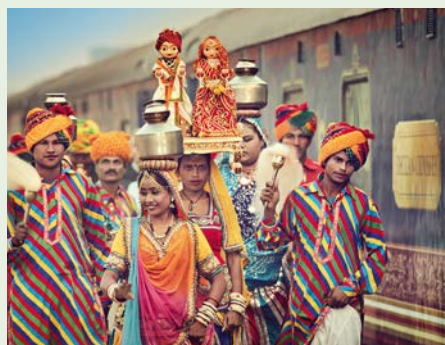
Sie fahren mit dem Deccan Odyssey.

„Das Klingelton-Prinzip: Hofmusiker signalisierten dem Mogul-Kaiser mit einer bestimmten Melodie, wer sich gerade zur Audienz einfand.“