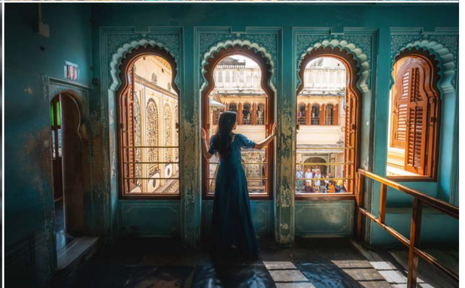
Inderin in klassischem Sari