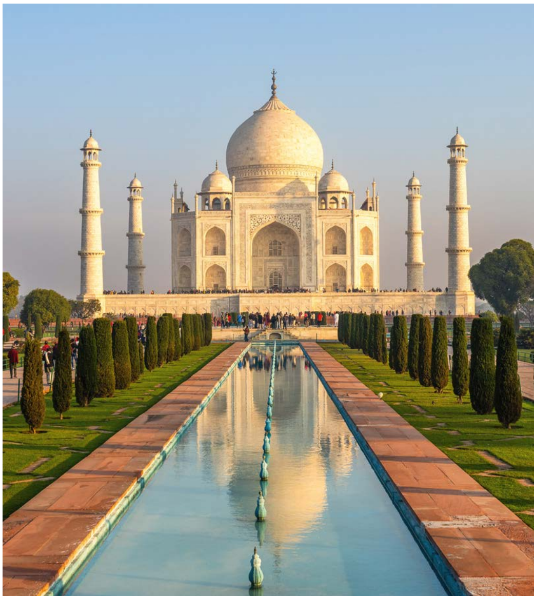
Der Taj Mahal in Agra