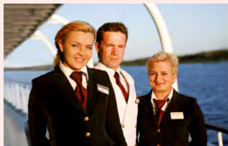
Sie fahren mit der MS Volga Dream. Details finden Sie auf Seite 91.

„Der perfekte Service und die kulinarischen Erlebnisse auf dem komfortabelsten Schiff auf der Wolga sind eine wahre Freude!“