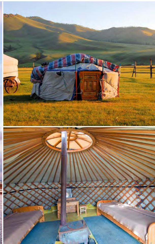
In Ihrer Hotel-Jurte

Selenga und weiter durch die wilden, einsamen Bergsteppen Ostsibiriens. Unterwegs Zwischenstopp in Ulan Ude und Möglichkeit zu einer Stadtrundfahrt ( Ausflugspaket ). Den Abschluss des Tages bildet ein stimmungsvolles Abendessen. Auch die Grenzformalitäten beim Überqueren der russisch-mongolischen Grenze können der Ruhe keinen Abbruch tun: Sie finden ganz einfach im Zug statt. ( FMA )