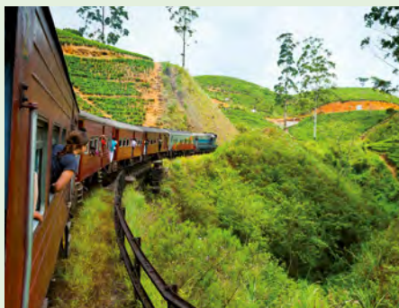
Per Zug durch Sri Lanka

„Weltweit einmalig: Auf der Fahrt von Demodara nach Nanu Oya machen Sie mit dem Zug einen Looping!“