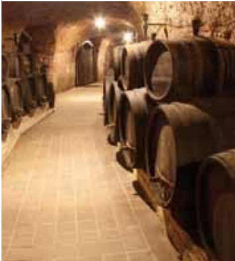
Besuch einer Whisky-Destillerie