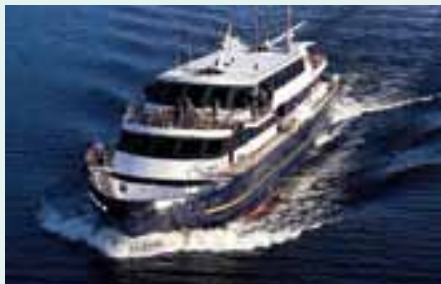
Sie fahren mit der MV Lord of the Glens. Details finden Sie auf Seite 5.

„Zerklüftete Bergketten, mittelalterliche Schlösser und idyllische Meeresbuchten werden Sie auf dieser Reise verzaubern.“