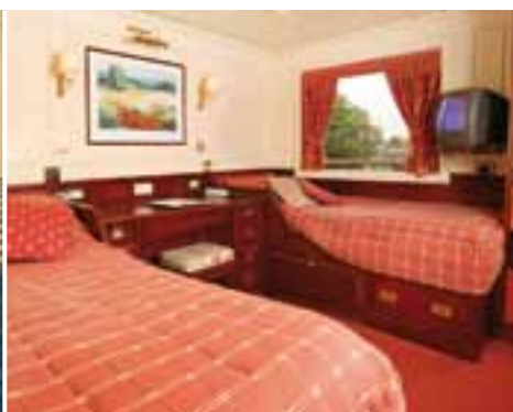
Standard-Kabine David Roberts-Deck