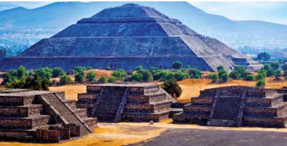
Pyramidenstadt Teotihuacán (UNESCO-Weltkulturerbe)