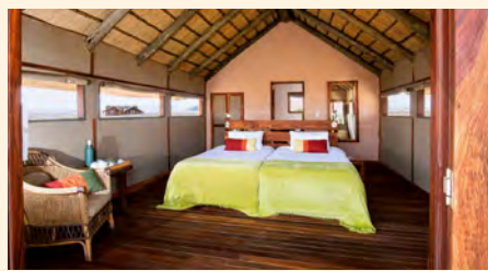
Zelt der Kulala Desert Lodge

„Das Okavango-Delta gehört zu den großen Naturwundern dieser Erde – ein einzigartiges Ökosystem.“