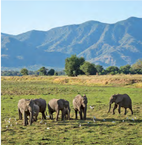
Elefanten im Mana Pools-Nationalpark