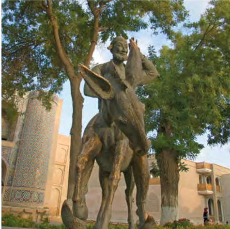
Nasreddin-Denkmal in Buchara