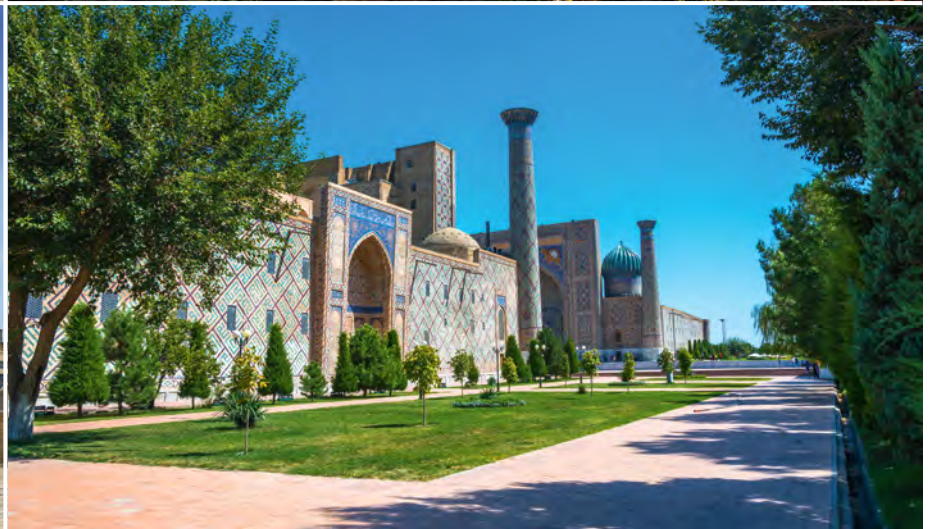
Freitagsmoschee in Taschkent