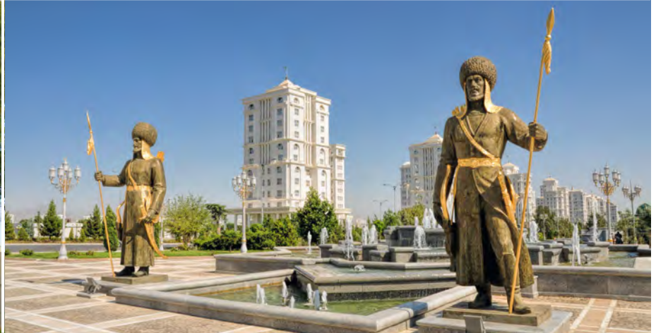
Unabhängigkeitsmonument in Aschgabat

18. Jh. eine bescheidene Wiedergeburt und baute das alte Bewässerungssystem wieder auf, bis der Emir von Buchara 1795 die Dämme erneut zerstörte. Geblieben sind unwirklich scheinende, eindrucksvolle Ruinen in der Wüste. Zu Mittag essen Sie heute bei einer Familie. Anschließend reisen Sie nach Aschgabat, wo Sie am späten Abend eintreffen. Sie übernachten im Mittelklasse-Hotel. (FMA)