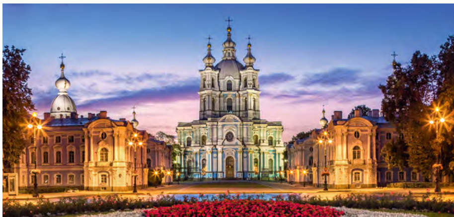
Smolny-Kathedrale in St. Petersburg

Diese Reise ist allgemein nicht für Personen mit eingeschränkter Mobilität geeignet. Bitte kontaktieren Sie uns, um hierzu genauere Informationen unter Berücksichtigung Ihrer persönlichen Bedürfnisse zu erhalten.