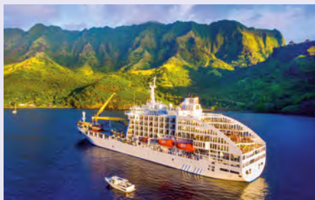
Sie fahren mit dem Postschiff Aranui 5. Details finden Sie auf Seite 113.

„Das ist nur wenigen Menschen vergönnt: Auf Pitcairn bestaunen Sie Schiffsbibel, Kanone und Anker der Bounty und treffen die direkten Nachkommen der Meuterer.“