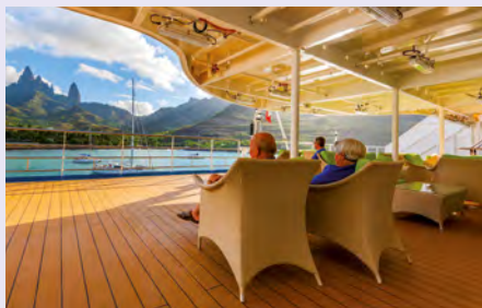
Auf dem Sonnendeck der Aranui 5