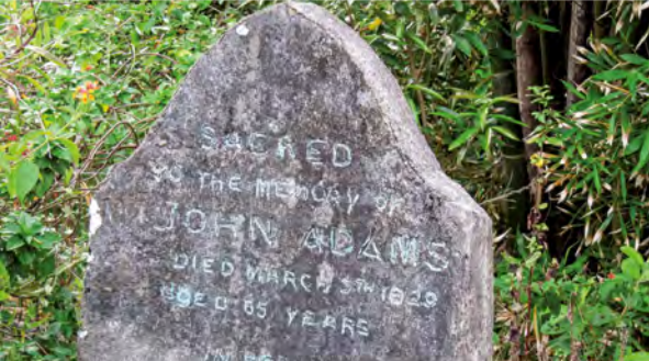
Grab von John Adams auf Pitcairn