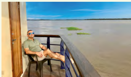
Sie fahren mit der MS Jangada. Details finden Sie auf den Seiten 108 und 109.

„Extrem üppige Artenvielfalt – drei Wörter, die den Superlativ des Pantanals am besten beschreiben!“