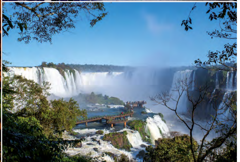
Die beeindruckenden Wasserfälle von Iguazú (UNESCO-Welterbe)

3. Tag Wasserfälle von Iguazú: UNESCO-Weltnaturerbe Heute besichtigen Sie die argentinische Seite der Wasserfälle. Ihr Rundgang windet sich entlang der Felsen um den riesigen Talkessel, sodass Sie dieses ungezähmte Naturschauspiel hautnah miterleben. Durch den dichten Regenwald streifen Tapire und Ameisenbären, Nasenbären, Ozelote, Fischotter und sogar Jaguare. (F)