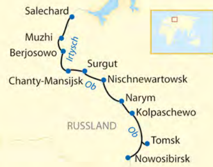
Flussschleife des Ob-Flusses