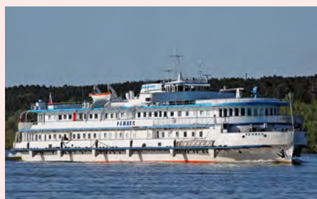
Sie fahren mit der MS Remix. Details finden Sie auf Seite 95.

Reisen Sie auf den gewaltigen Strömen Ob und Irtytsch vom Herzen Sibiriens bis zum Polarkreis. Erleben Sie den Übergang von dichter immergrüner Taiga in die unendliche Weite der Tundra. Hier relativiert sich das Verhältnis zwischen Mensch und Natur. Und doch wagten sich seit dem 16. Jh. Kosaken, Kaufleute und Goldgräber in die dünn besiedelte Heimat von Chanten, Mansen und Nenzen. Erdöl und Erdgas machten die Städte an Ob und Irtytsch unlängst zu den reichsten des Landes. Добро пожаловать – herzlich willkommen in Sibirien!