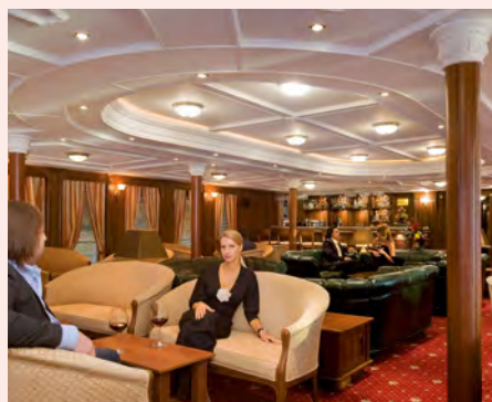
Sie fahren mit der MS Volga Dream. Details finden Sie auf Seite 89.

„Entdecken Sie beim Bummel durch Kasan den faszinierenden Architektur-Mix aus Orient und Okzident!“