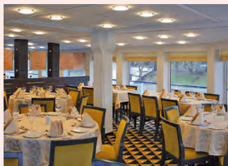
Sie fahren mit der MS Mstislaw Rostropowitsch. Details finden Sie auf Seite 88.

„Genießen Sie den Aufenthalt an Bord in Ihrer Balkonkabine und lassen Sie die märchenhafte Landschaft Kareliens an sich vorüberziehen.“