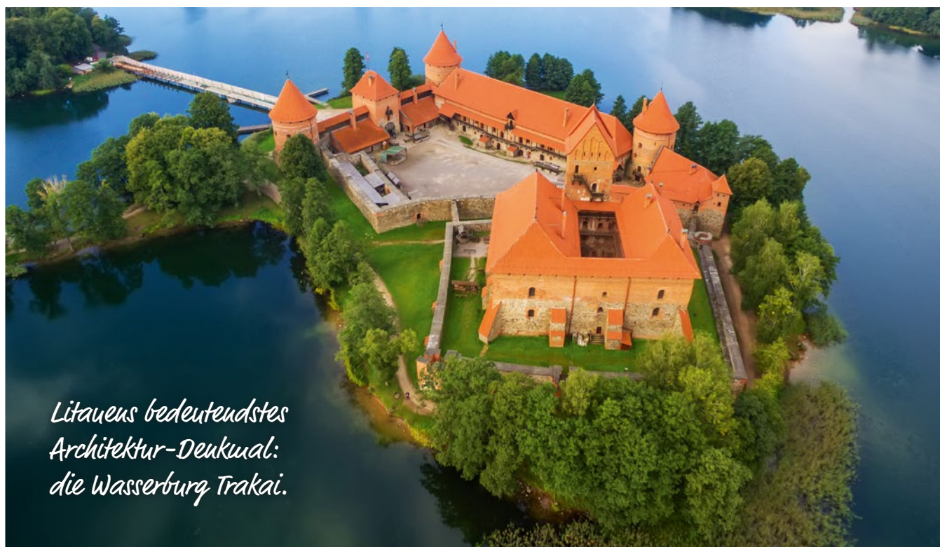
Litauens bedeutendstes Architektur-Deukual: die Wasserburg Trakai.