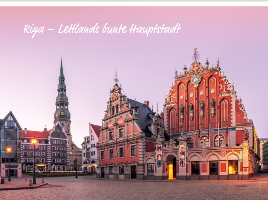
Riga – Lettlands bunte Hauptstadt

Nach den sportlichen Leistungen der letzten Tage gönnen wir uns heute mal eine Auszeit vom Sattel. Ein radelfreier Tag in Riga! Lettlands Hauptstadt atmet den Geist der Hanse. Das herrliche Schwarzhäupterhaus, das Schwedentor, das Gebäude-Ensemble der Drei Brüder, der gewaltige Dom, mittelalterliche Kaufmannshäuser und das prächtige Schloss – die ganze Stadt gleicht einem Freilichtmuseum. Am Vormittag erkunden wir die Altstadt bei einem geführten Rundgang. Der Nachmittag steht uns für eigene Erkundungen zur freien Verfügung. Ein Abstecher zum Markt in den alten Zeppelinhallen und die Jugendstilstraßen Rigas sind echte Highlights.