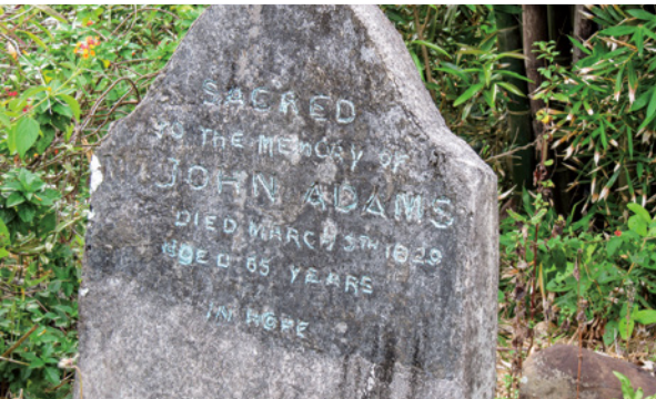
Grab von John Adams auf Pitcairn