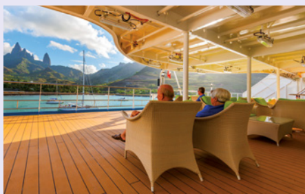
Auf dem Sonnendeck der Aranui 5