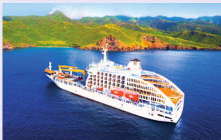
Sie fahren mit dem Postschiff Aranui 5.

„Das ist nur wenigen Menschen vergönnt: Auf Pitcairn bestaunen Sie Schiffsbibel, Kanone und Anker der Bounty und treffen die direkten Nachkommen der Meuterer.“