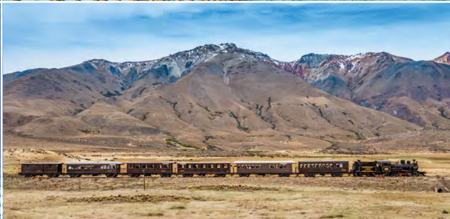
Historischer Dampfbahn auf der Schmalspurbahn La Trochita

nach der Grenze den höchsten Punkt Ihrer Reise. Von hier geht es durch immergrünen valdivianischen Regenwald hinunter nach Peulla, wo ein schmackhaftes Mittagessen auf Sie wartet. Bei der Umrundung des riesigen Lago Llanquihue erblicken Sie dann erstmals den schneebedeckten Bergriesen des Vulkans Osorno. Diesen unvergesslichen Traumblick genießen Sie auch von Ihrem wunderschönen Komfort-Hotel direkt am See. Die kommenden zwei Nächte logieren Sie in Puerto Varas. (FMA)