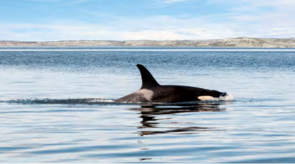
Orca vor der Küste der Península Valdés

erkunden die abgeschiedene Halbinsel Valdés. Das gut 3.600 km 2 große UNESCO-Weltnaturerbe gilt als Geheimtipp der Biodiversität und spielt in einer Liga mit den Galápagos-Inseln. Hier leben mehr Tiere als Menschen! Im Oktober und November kommen Gattwale der Küste so nah, dass man sich fragt, wer eigentlich wen beobachtet. Und im Februar jagen räuberische Orcas hier direkt am Strand. Zu jeder Jahreszeit heißt es in der Estancia San Lorenzo: Bühne frei für die Parade der Magellan-Pinguine! Punta Norte, der Spielplatz der Seelöwen und See-Elefanten liegt gleich nebenan. Mit etwas Glück sichten Sie auf der Rückfahrt Nandus und Guanakos. (FM)