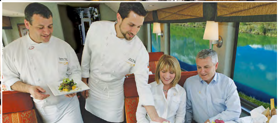
Restaurant der GoldLeaf Class