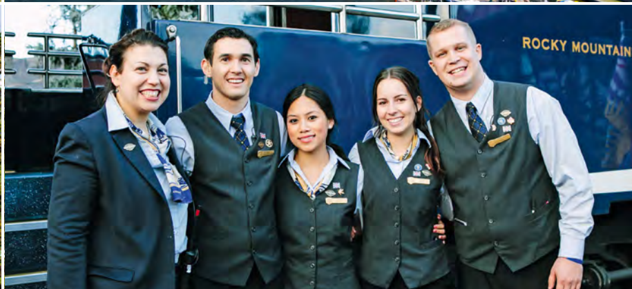
Ihr freundliches Personal

13. Tag Vancouver: Tradition und Moderne Auf einer Busrundfahrt lernen Sie die von Gegensätzen geprägte Stadt kennen. Die Altstadt Vancouvers mit ihren liebevoll restaurierten Gebäuden aus viktorianischer Zeit ist heute ein attraktives Vergnügungsviertel. Nach dem Besuch des quirligen Stadtteils Chinatown und des Chinesischen Gartens unternehmen Sie eine Panorama-Fahrt durch den Stanley-Park. Von hier aus können Sie einen Blick auf die Skyline von Downtown Vancouver werfen und im Park aufgestellte Totempfähle besichtigen. Den Nachmittag verbringen Sie in der reizvollen Umgebung Vancouvers. (F)