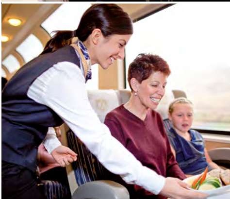
Mittagessen in der SilverLeaf Class