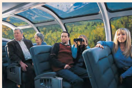
Sie fahren im Canadian und im Rocky Mountaineer. Details finden Sie auf den Seiten 196 und 197.

„Fünf-Uhr-TEE in Victoria: Englischer als im Vereinigten Königreich.“