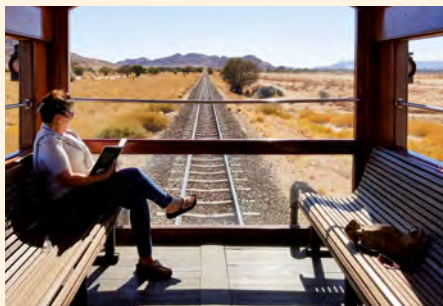
Sie reisen mit dem Sonderzug African Explorer. Details finden Sie ab Seite 188.

„Mein Tipp: Bestaunen Sie die Viktoriafälle bei einem Helikopterflug!“