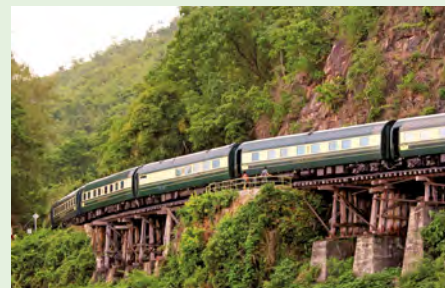
Sie fahren mit dem Eastern & Oriental Express. Details finden Sie auf den Seiten 184 und 185.

„Verbinden Sie Ihre Zugreise an Bord des legendären E & O mit einem Aufenthalt in den Weltstädten Singapur und Bangkok!“