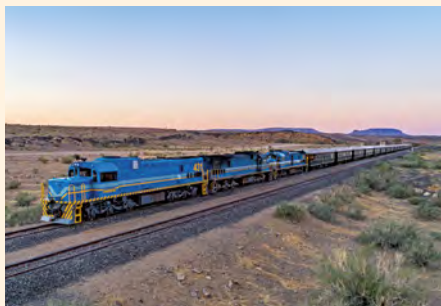
Sie reisen mit dem Sonderzug African Explorer. Details finden Sie ab Seite 188.

„Ein Muss für Eisenbahn-Fans: Garratt-Dampflok und Rhodes' originaler Salon-Wagen im Bahn-Museum von Bulawayo.“