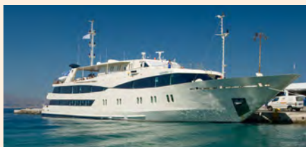
Sie fahren mit der MY Harmony V. Details finden Sie auf Seite 157.

„Die weltberühmte Sängerin Cesária Évora (1941 – 2011) trat als barfußige Diva traditionell ohne Schuhe und Strümpfe auf.“