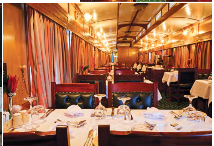
Ihr hilfsbereites Personal