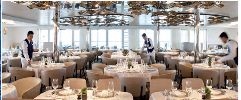
Exquisiter Service an Bord der Le Dumont-d'Urville

kommenden sieben Nächten logieren Sie in Ihrer komfortablen Kabine an Bord. (FMA)