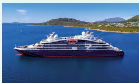
Sie fahren mit dem Ponant-Schiff Le Dumont-d'Urville. Details finden Sie auf Seite 21.

„Für Wale scheinen die Azoren ein heiliger Ort zu sein. 24 Arten tummeln sich hier – ein Drittel aller Walarten weltweit!“