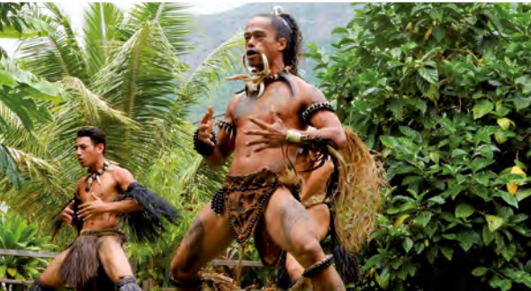
Tänzer in Ua Pou