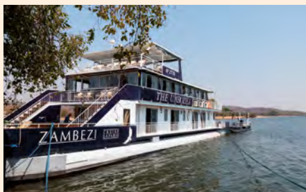
Sie fahren mit dem Hausboot Umbosha. Details finden Sie auf Seite 171.

„Lauschen Sie dem Gurren der Flusspferde und beobachten Sie das tierische Treiben am Ufer bequem aus den gepolsterten Sesseln auf dem Oberdeck.“