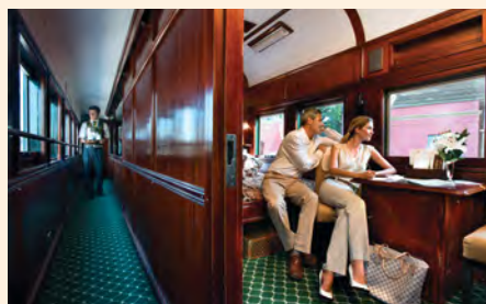
Sie fahren im exklusiv gecharterten Rovos Rail-Sonderzug. Details finden Sie ab Seite 172.

„Das hätte Livingstone wohl auch gefallen: Ein Helikopterflug über die Viktoriälfälle! Sie haben die Chance dazu.“