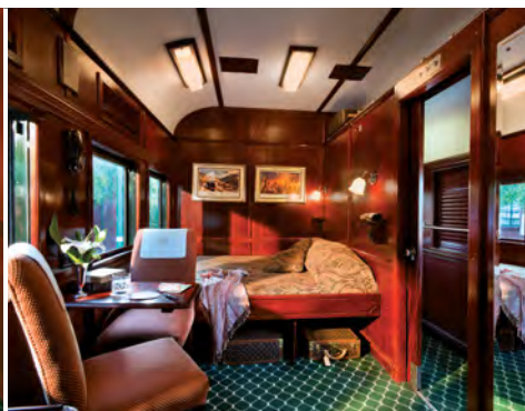
Abteil der Kategorie Deluxe