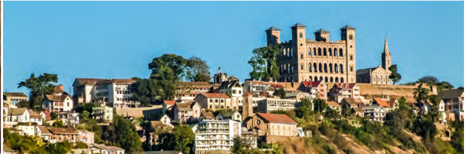
Der ehemalige Königspalast Rova von Antananarivo auf der Analamanga-Erhebung

13. Tag Die Allee der Baobabs Der verschlafene Hafentort Morondava ist Ausgangspunkt eines aufregenden Tages. Heute besuchen Sie den riesigen Trocken- und Dornwald des Kirindy-Nationalparks, Treffpunkt für Forscher aus aller Welt. Denn zahlreiche Lemuren-Arten wie der Larvensifaka oder Rotstirnaki, aber auch Schlangen, Leguane, Flamingos, 90 Schmetterlingsarten und die endemische Kängururatte fühlen sich hier pudelwohl – vor allem aber ein unheimliches Wesen, das nur auf Madagaskar vorkommt: die Fossa. Dieses Raubtier lässt sich während der Paarungszeit Ende November/Anfang Dezember bestens beobachten. Am Nachmittag ein Fotomotiv für die Ewigkeit: Staunend stehen Sie in der Allee der Baobabs in einer Landschaft wie auf einem anderen Planeten. Beseelt von diesen Eindrücken geht es zurück an Bord und beim rauschenden Champagner-Dinner auf Ihre letzte Etappe. (FMA)