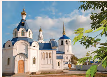
Orthodoxe Kathedrale in Ulan Ude

„Es ist wirklich unglaublich, wie präsent der Schamanismus rund um den Baikalsee immer noch ist.“