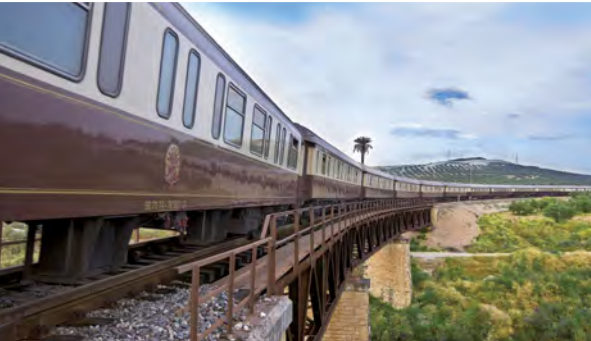
Der Al Ándalus