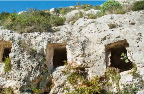
Höhlenwohnungen in Pantalica