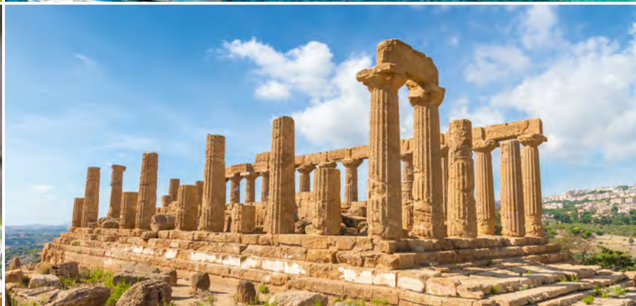
Tal der Tempel in Agrigento

boli und bewundern glühende Lava – ein faszinierendes und unheimliches Spektakel zugleich! (FMA)