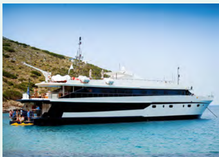
Sie fahren mit der Motor-Yacht Harmony G. Details finden Sie auf Seite 135.

„Ein Spektakel: Sie bewundern unter der Sciarra del Fuoco (Feuerwand) die Ausbrüche des Vulkans Stromboli vom Meer aus.“