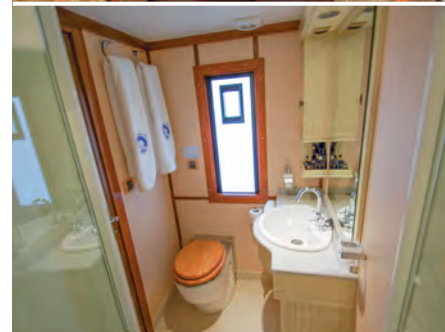
Badezimmer der Deluxe-Suite, darunter: Doppelbett der Deluxe-Suite