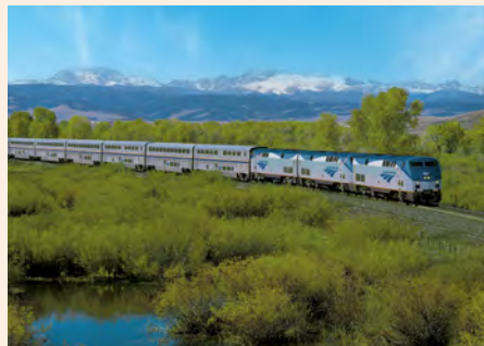
Sie fahren mit Linienzügen von Amtrak. Details finden Sie auf Seite 132.

„Erst 1850 wurde Kalifornien als 31. Staat in die USA aufgenommen. Im 18. Jh. gehörte es zu Spanien, ab 1821 zu Mexiko.“