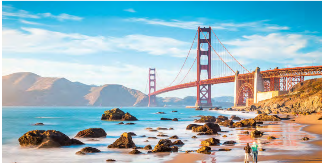
Golden Gate Bridge in San Francisco