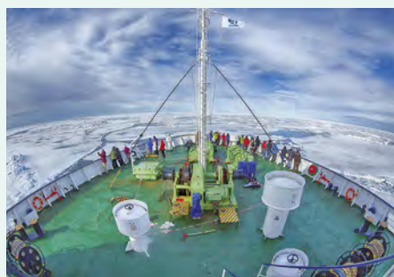
Sie fahren mit der MS Ortelius. Details finden Sie auf Seite 125.

„Wussten Sie, dass die Hautfarbe der strahlend weißen Eisbären überraschenderweise pechschwarz ist, damit sie Wärme besser speichern können?“