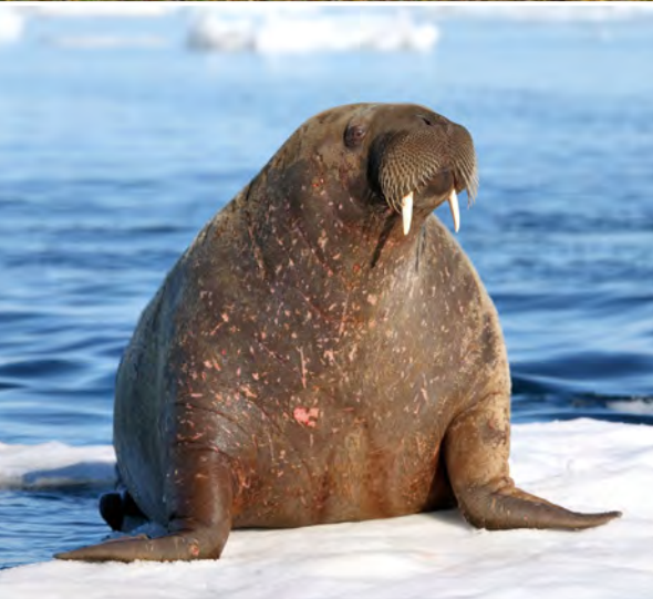
Walross in Spitzbergen