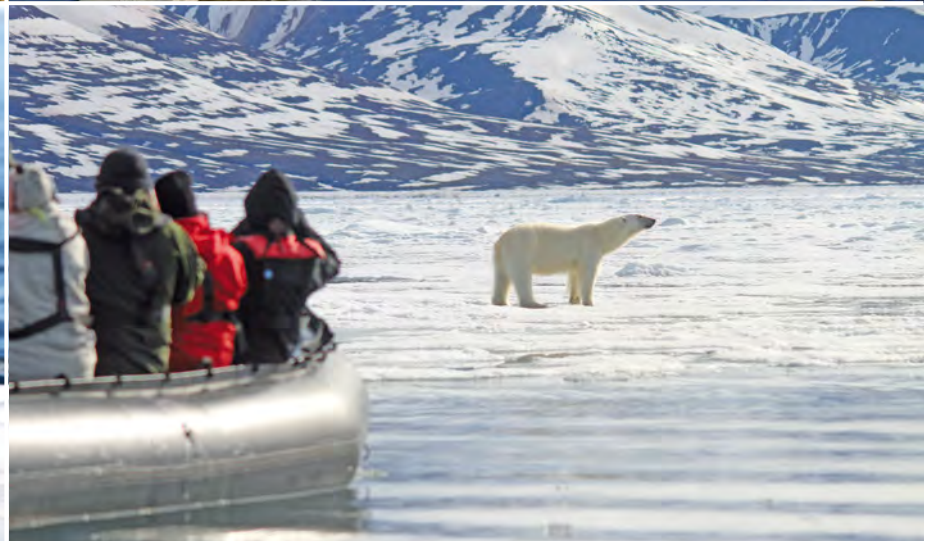
Unterwegs im Zodiac

der Nordküste Westspitzbergens geplant. Spektakuläre Gletscher dominieren die wunderschöne Szenerie, Ringel- und Bartrobber sind hier zu Hause, und auch Eisbären werden oft gesichtet. Abends geht Ihre Reise weiter in Richtung Moffen Island – hier können Sie mit etwas Glück Walrosse beobachten. Das tief stehende Sonnenlicht im Spätsommer lässt alle Landschaften in warmen Tönen erstrahlen. (FMA)