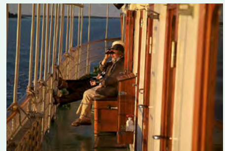
Sie fahren mit der MS Diana. Details finden Sie auf Seite 119.

Sollten Sie eine Reise komplett ohne Flüge bevorzugen, unterbreiten wir Ihnen gern ein persönliches Angebot für die An- und Abreise per Schiff und Zug. Anreise z. B. mit Stena Line von Kiel nach Göteborg und Abreise z. B. per Zug von Stockholm über Kopenhagen nach Deutschland.