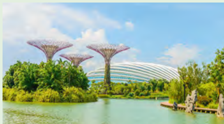
Supertrees in Singapur

Sie möchten bereits 2019 reisen oder jetzt schon einen Termin im Jahr 2021 buchen? Bitte sprechen Sie uns an!