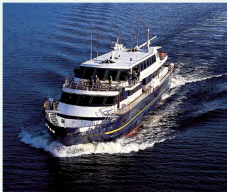
Sie fahren mit der MV Lord of the Glens. Details finden Sie auf Seite 116.

„Dudelsack, Whisky, ehrwürdige Herrensitze und viele Lochs – all das macht für mich Schottland aus.“