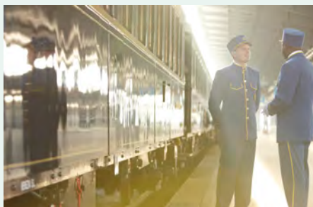
Sie fahren im originalen Venice Simplon-Orient-Express. Details finden Sie ab Seite 120.

„Als Vorbereitung auf die Zeitreise nach Paris empfehle ich Woody Allens herrliche Zeitreise-Komödie Midnight in Paris .“