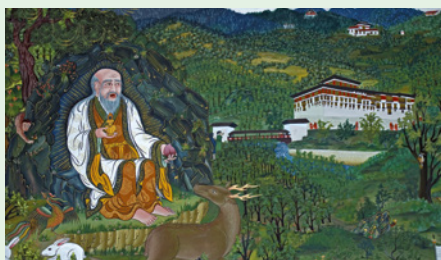
Thangka – Rollgemälde der Buddhisten

„Das bhutanische Nationaltier Takin sieht aus wie eine Kreuzung aus Rind, Ziege und Gnu und stellt mit Leichtigkeit jedes Fabeltier in den Schatten!“