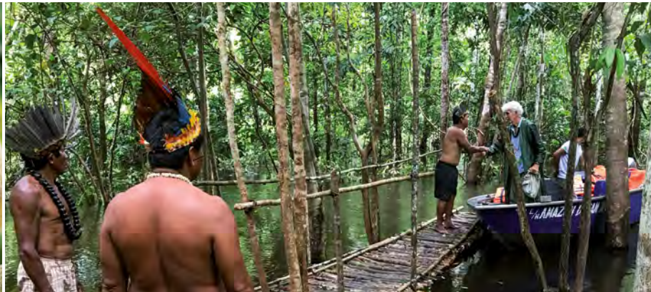
Per Beiboot zu den Tikuna

sehr zurückgezogen lebenden Matis- und Maré-Ureinwohnern. Zunächst werden Sie vom Schamanen der Maré begrüßt, der Sie in die Welt der Heilpflanzen einführt. Nach einer Dschungelwanderung treffen Sie die Matis, die erst seit wenigen Jahrzehnten Kontakt zur Außenwelt haben. Bei diesem Treffen lernen Sie Lebensweise, Jagdpraktiken und Rituale der Ureinwohner kennen. Nachmittags stehen ein Spaziergang durch Benjamin Constant und eine Bootsfahrt entlang der peruanischen Grenze auf dem Programm. (FMA)