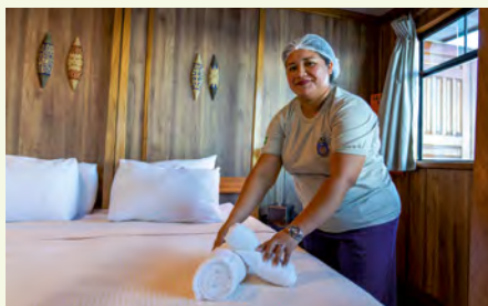
Sie fahren mit der MS Jangada. Details finden Sie auf den Seiten 108 und 109.

„Spitzen Sie Ihre Ohren: Der im Regenwald beheimatete Vogel Uirapuru singt nur ein einziges Mal im Jahr – beim Nestbau.“