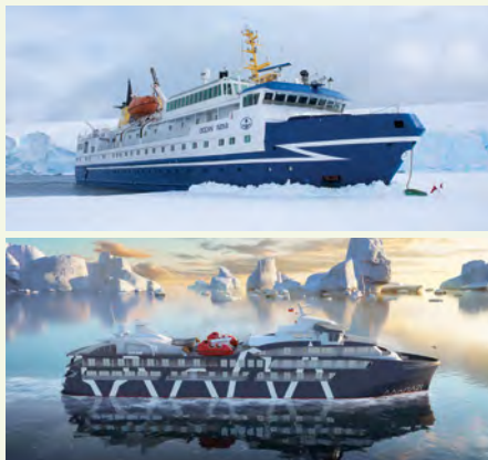
Sie fahren mit der MS Ocean Nova oder MS Magellan Explorer. Details finden Sie auf Seite 103.

„Sie sparen sich die mühsame Überfahrt durch die Drake-Passage und gelangen bequem per Flugzeug in die Antarktis.“