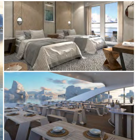
Veranda-Kabine, darunter: Restaurant

Die Kabinen (ca. 20 – 40 m 2 ) 37 Außenkabinen mit Kleiderschrank, individuell regulierbarer Heizung, Sitzecke, Bad und in den meisten Kategorien auch mit Balkon.