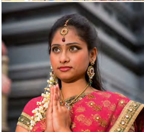
Inderin im klassischen Sari