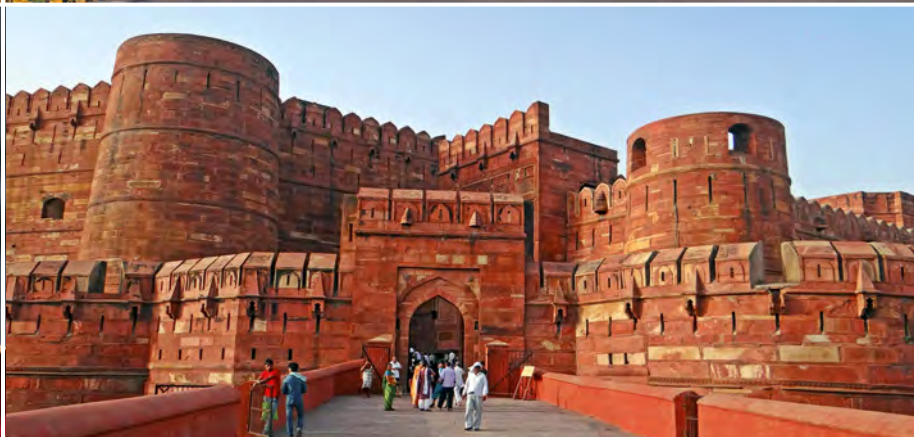
Das Rote Fort in Agra

Ihr Indien-Abenteuer geht weiter! Sie entdecken die schillernde Stadt Mumbai und gelangen nach Mani Bhawan, dem Wohnhaus Mahatma Gandhis. Nach dem Besuch der archäologischen Schätze im Prince of Wales Museum geht es zum Gateway of India, dem Wahrzeichen der Stadt. Hier startet Ihre Hafentour, die Ihnen Mumbais funkelnbeses Lichtermeer und seine berühmte Strandpromenade Marine Drive aus einer ganz besonderen Perspektive zeigt. Sie übernachteten heute im De-luxe-Hotel. (FA)