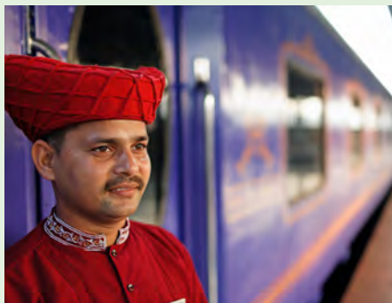
Sie fahren mit dem Deccan Odyssey. Details finden Sie auf Seite 99.

„Unterschiedliche Klingeltöne zum Erkennen des Anrufers? Nichts Neues: Schon die Mogul-Kaiser erkannten an der Melodie ihrer Musiker, welche wichtige Person sie gerade besuchen wollte.“