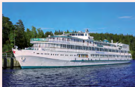
Sie fahren mit der MS Thurgau Karelia. Details finden Sie auf Seite 96.

„Tataren, Tschuwaschen, Kalmücken – in der Wolga-Region erleben Sie, wie facettenreich der Vielvölkerstaat Russland ist.“