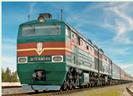
Sie fahren mit dem Orient Silk Road Express. Details finden Sie ab Seite 94.

„Als Reise-Lektüre empfehle ich die oft sehr deftigen Anekdoten um den orientalischen Spaßvogel Nasreddin.“