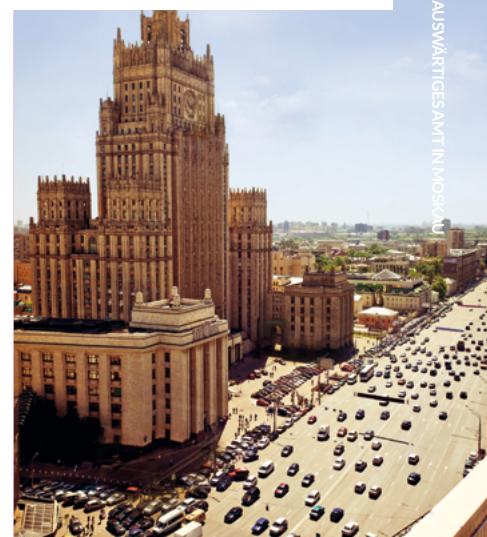
AUSWÄRTIGES AMT IN MOSKAU