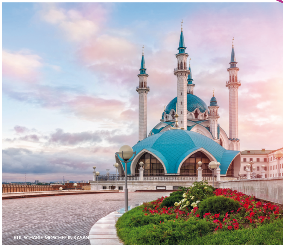
KUL-SCHARIF-MOSCHEE IN KASAN