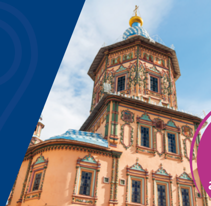
PETER-PAUL-KATHEDRALE IN KASAN