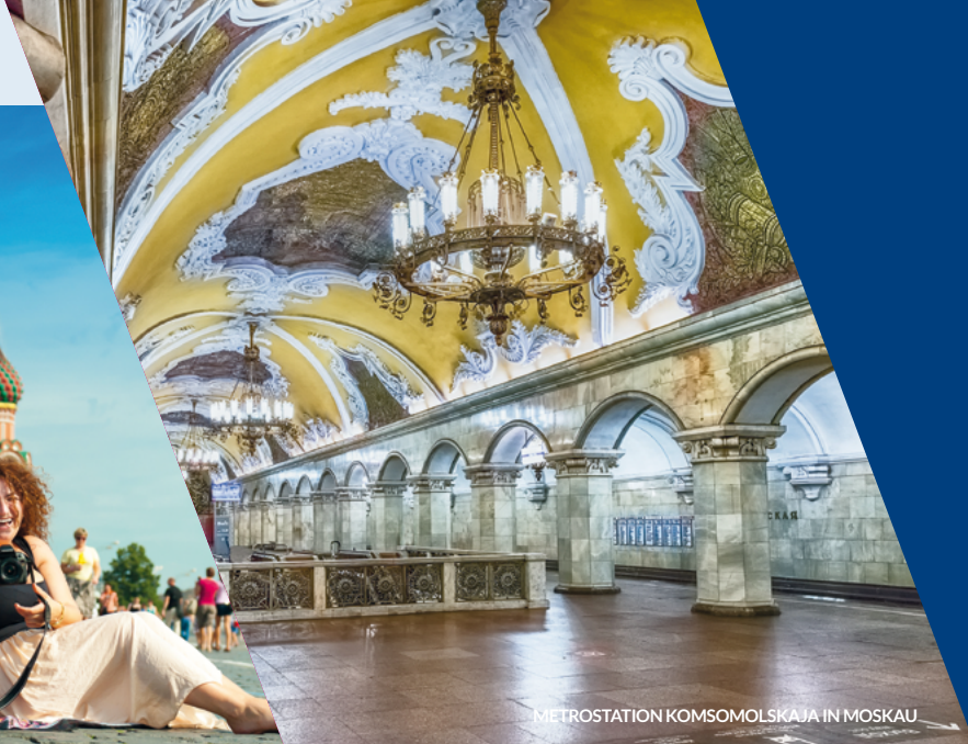
METROSTATION KOMSOMOLSKAJA IN MOSKAU