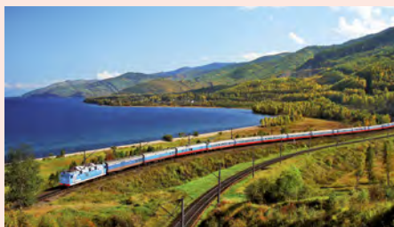
Sie fahren auf der Transsibirischen Eisenbahn im Linienzug. Details finden Sie auf Seite 64.

„Freuen Sie sich auf gleich drei Länder, deren Größe und Großartigkeit Sie nur auf Schienen erfahren können!“