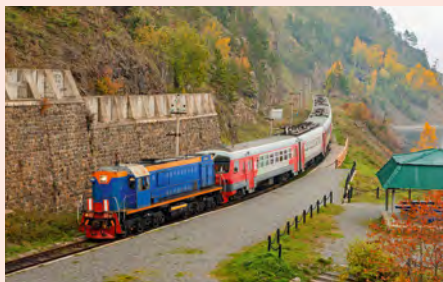
Sie fahren im Sonderwagen, der an Linienzüge der Russischen Bahn angehängt wird. Details finden Sie auf Seite 54.

„Das Wort Sibir steht im Tatarischen für schlafendes Land. Im Mongolischen bedeutet es so viel wie Waldesdickicht.“