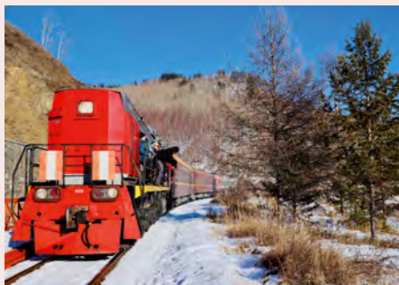
Sie fahren mit dem Zarengold-Sonderzug. Details finden Sie ab Seite 56.

„Sind Sie bereit, bei bis zu -40° C über den zugefrorenen Baikalsee zu spazieren, um danach im gut beheizten Sonderzug bei einem Gläschen Wodka zu entspannen?“