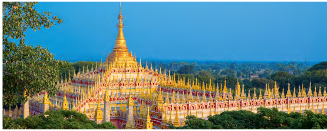
Thanboddhay-Pagode in Monywa