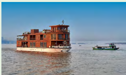
Sie fahren mit der RV Paukan 2012. Details finden Sie auf Seite 47.

„Liebhaber außergewöhnlicher Reisen kommen bei dieser Schiffsreise fernab der üblichen Besucherpfade voll auf ihre Kosten.“